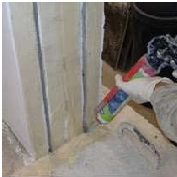
Σχήμα 7: ΠΟΕ

Επισημαίνεται ότι οι οπλισμοί των ΠΟΕ μπορεί να είναι σύνθετα υλικά.