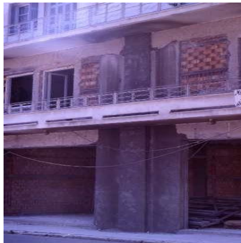
Σχήμα 6: Πλευρικά τοιχώματα

Τα τοιχώματα αυτά προστίθενται με στόχο την αύξηση της πλαστιμότητας της κατασκευής, με ταυτόχρονη μικρή αύξηση της αντοχής και της δυσκαμψίας της. Τοποθετούνται σε γωνιακά υποστυλώματα σε δύο διευθύνσεις ή σε εσωτερικά υποστυλώματα κατά μία διεύθυνση. Για την κατασκευή τους χρησιμοποιείται έγχυτο ή εκτοξευόμενο σκυρόδεμα, ή ακόμη και προκατασκευασμένα στοιχεία.