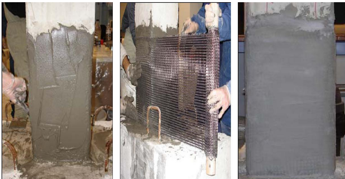
Σχήμα 2 (α,β,γ): Στάδια εφαρμογής IAM

Τα πλεονεκτήματά τους είναι η αύξηση της αντοχής και της παραμορφωσιμότητας, ενώ παρουσιάζουν προβλήματα ως προς τον εμποτισμό της κάθε ίνας ξεχωριστά από το μητρικό υλικό και ως προς τη διείσδυση του υλικού αυτού στο πλέγμα.