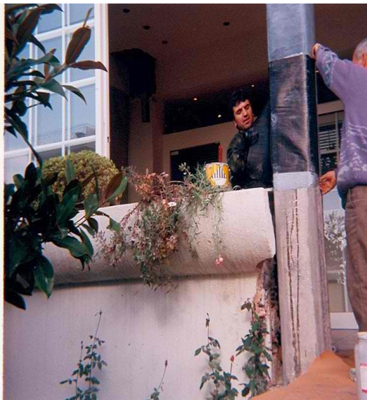
Σχήμα 1: FRP