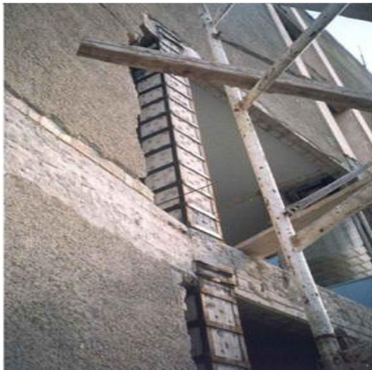
Σχήμα 3: Μεταλλικά ελάσματα