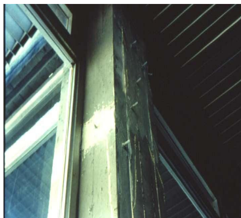
Σχήμα 4: Ρητινένηση

Να σημειωθεί ότι απαιτείται η κατάλληλη επιλογή εποξειδικής ρητίνης για κάθε περίπτωση.